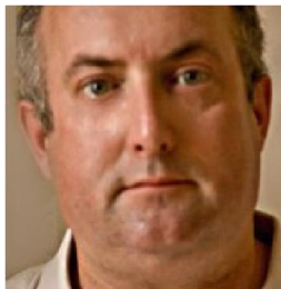
Όριαν Μακ Ζεαριαιλε Ταίριου Σουίη