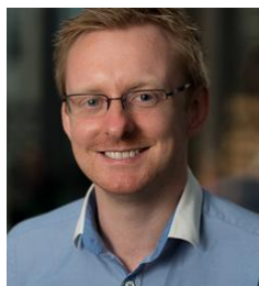
Ζορόβο Ο Κυρριάμ Μύνλα Σνό