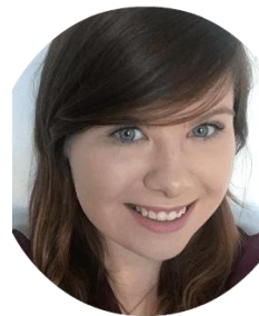
Μιχαέλιη ηί Μυηαά