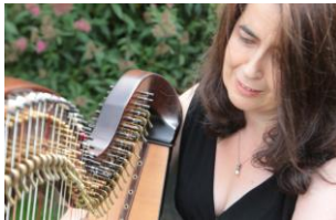
Αίλινξ Νί Κόνγκαίλε