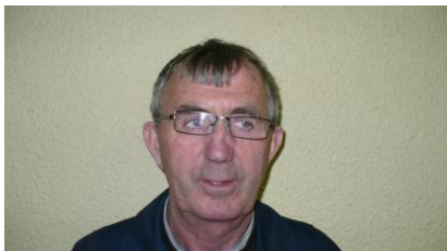
Σέαμαρ Ó Μυιρú Ceannairne an Stairóirte