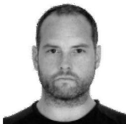
Cormac von Braun Κριυέαιόετ